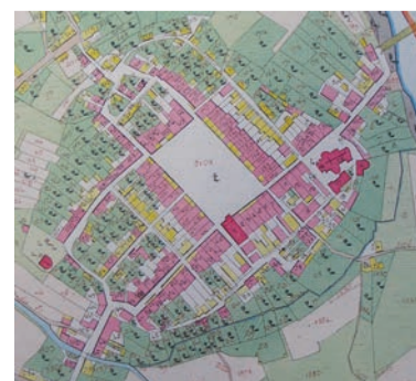
Náměstí Moravské Ostravy, stabilní katastr, 1833.