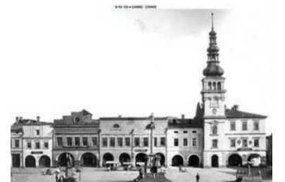
Jihovýchodní fronta náměstí s podloubími, foto, 1880 až 1890.