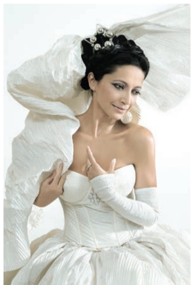
Vánoční písně zazní i 8. prosince v Gongu na koncertě Janáčkovy filharmonie a Lucie Bílé.